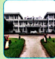
বাংলাদেশ বিমান বাহিনী শাহীন কলেজ পাহাড়কাঞ্চনপুর