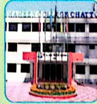
বাংলাদেশ বিমান বাহিনী শাহীন কলেজ চট্টগ্রাম