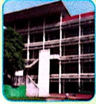
বাংলাদেশ বিমান বাহিনী শাহীন কলেজ ঢাকা