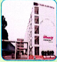
বাংলাদেশ বিমান বাহিনী শাহীন কলেজ কুর্মিটোলা