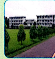
বাংলাদেশ বিমান বাহিনী শাহীন কলেজ শমশেরনগর