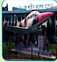
বাংলাদেশ বিমান বাহিনী শাহীন কলেজ যশোর